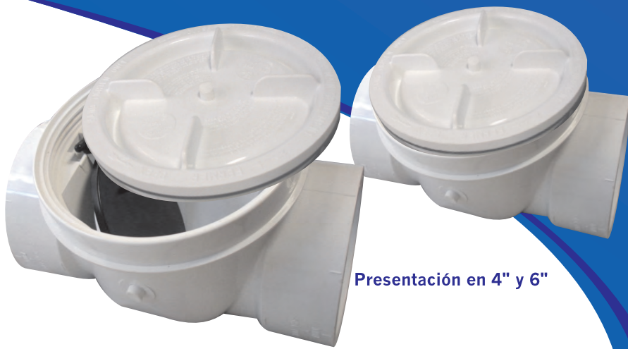
Presentación en 4" y 6"

Es una forma efectiva de mantener la fauna nociva (roedores, cucarachas, zancudos, etc) que deambulan en los colectores públicos, aislados de las residencias y construcciones en general.